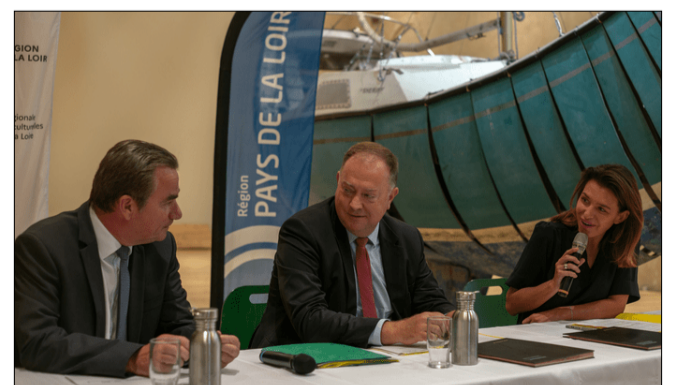
Signature du volet culture et patrimoine, à la Chapelle du Genêteil, Centre d'Art contemporain à Château-Gontier-sur-Mayenne, inscrit au CPER 2021-2027

Signé le 31 août 2022, l'avenant au CPER dédié à la culture et à la valorisation du patrimoine prévoit un engagement paritaire de l'État et de la Région à hauteur de 22,5 M€ chacun pour 20 opérations emblématiques.