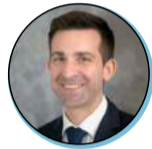
Johann FAURE Sous-préfet à la relance (jusqu'au 16/08/2022)