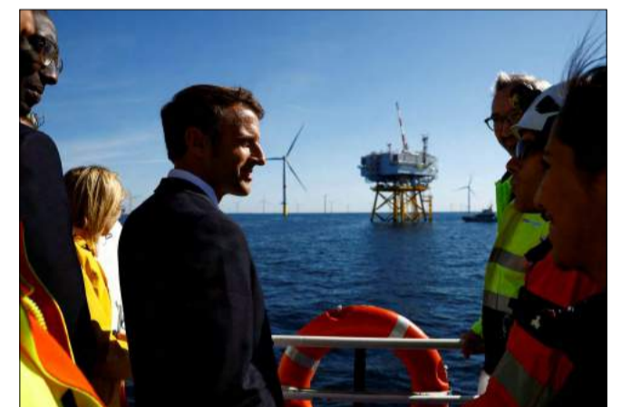
Emmanuel Macron, lors de l'inauguration du parc éolien à Saint-Nazaire

Le parc éolien du banc de Guérande, doté de 80 éoliennes d'une puissance de 480 MW, produit l'équivalent de la consommation électrique annuelle de 700 000 personnes, soit 20 % de la consommation en Loire Atlantique.