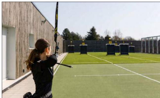
L'État a soutenu la création du CREPS à hauteur de 5,5 M€.