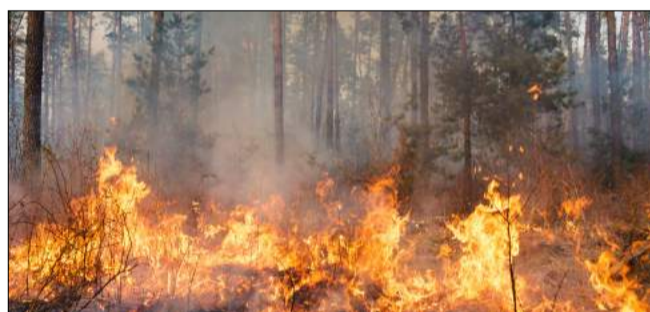
Un été 2022 marqué par les feux de forêt avec 2200 ha brûlés