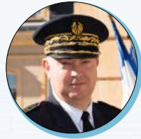
Didier MARTIN Préfet de la région Pays de la Loire Préfet de la Loire-Atlantique

Comme 2020 et 2021, cette année aura encore été marquée par la pandémie Covid-19 ; se sont rajoutées les nombreuses conséquences de la guerre en Ukraine même si les répercussions économiques et sociales en ont été réduites par l'action des pouvoirs publics et par la réactivité des collectivités, entreprises, associations. Tous les services de l'État en Pays de la Loire ont de nouveau été au rendez-vous de cette année complexe.