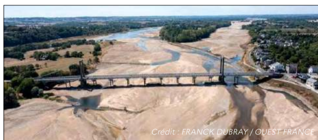
Sécheresse : Mobilisation des services de l'État (bulletins hydrologiques, arrêtés sécheresse, contrôle des installations...)